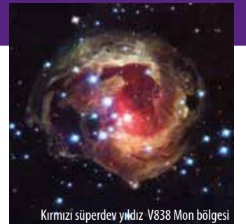
Kırmızı süperdev yıldız V838 Mon bölgesi