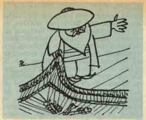
Halının altındaki hiç.

Etraf önce renksiz, sonra yavaş yavaş renklenecektir. Sinir sisteminin renk bilgilerini ileten kısmı, başta gelişmemiştir. Belki kendisini tanımadan önce annesini tanıyacaktır. Bütün sevgi akımı, duygularını annesine doğru yönelecektir. Dışardaki cisimleri ayırma gücü olmadığı için, zevklerin kaynaklarını karıştıracaktır. Meme ile emzik ona aynı zevki verecektir. İlk yazımızda belirttiğimiz gibi, dış cisimlerin etkilerini kendi içinden ayıramıyorsa, hata yapmamaktadır; çünkü bu etkilerle ortaya çıkan cisimlerin hayalleri, gerçekte kendi içinde yer bulmaktadır. Bütün dünyayı tek ve bir kabul etmekle, kendi mantığı içinde yerden göğe kadar haklıdır. Bu sadece duygular, istekler, kaprisler karmaşasından meydana gelmiş en ilk şahsiyet kısmına Şu (ya da İd) diyoruz. Adeta ben'den uzaklaşmış bir şey. Çocuk kendini dış dünyadan ayırmağa başladığı an Ben (ya da Ego) teşekkül eder. Bu gerçeği bir kısımdır. Artık hareket başlamıştır. Çocuk, kendi isteği ile hareket edebilir, yerini değiştirebilir. Bazı duygulardan kaçamadığını, bazı cisimlerden kaçabildiğini farkeder. Kendi adaleleri ile ilgili duyguların daima kendini takip ettiğini, dış eşyaların kendisi ile beraber oynamadığını ayırt eder. Eşyalar başlangıçta anlamsızdır. Bardağın, kapının, masanın ne için kullanıldığının bilincine varmamıştır çocuk. Bunlara kendine göre duygularla bağ-