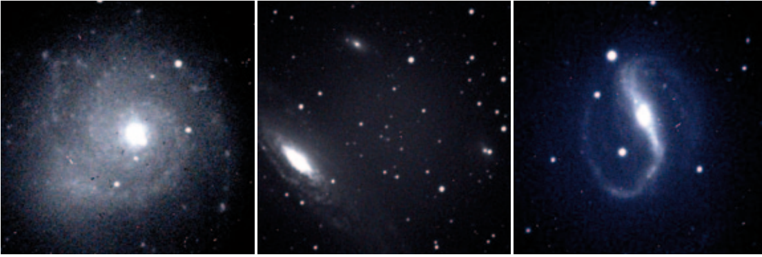
Ulupınar Gözlemevi'ndeki 122 cm ayna çaplı teleskopla çekilen ilk görüntüler. Soldan sağa M74, NGC 7331 ve NGC 7479

lisans programı başlatıldı. Bu dönemde toplam 75 yüksek lisans ve doktora öğrencisi yetiştirildi. 17'si doktoralı, 32 üyesi olan merkez Türkiye'nin en güçlü Astrofizik Araştırma Merkezi durumuna getirildi. 16. Ulusal Astronomi Kongresi ve 5. Ulusal Öğrenci Astronomi Kongresi Eylül 2008'de bu merkezde düzenlendi. Yine bu dönemde beş ulusal, beş de uluslararası bilimsel toplantı düzenlendi. Gözlemevi'nde yapılan gözlemlere dayalı olarak elde edilen önemli bazı bilimsel katkılar da şöyle özetlenebilir: Bu dönemde Merkez üyeleri tarafından atıf indekslerine giren dergilerde 136 yayın yapılmış, 7 örten çift yıldız keşfedilmiş, Merkez üyeleri tarafından yazılan bir ders kitabı Cambridge Üniversitesi yayınları arasında basılmıştır. Çift yıldız yörüngelerinin fazla açısal momentum kaybı nedeniyle gittikçe küçüldüğü ve zaman içinde çift yıldızların tek yıldızla dönüştüğü ilk kez bu gözlemevinde kanıtlanmıştır. Yıldız sistolojisinin, yakında başka bir yıldız olması halinde, o yıldızın kütle çekimine bağlı olduğu gözlemlerle gösterilmiştir. Kuramsal kozmoloji alanında ise kuark gluon plazmayla ilgili çok önemli yayınlar yapılmıştır. Çift yıldızların etrafında, görünmeyen başka yıldızların bulunabileceği ve bu istatistiğin oldukça yüksek olduğu kanıtlanmıştır. Çift yıldızların etrafında da gezegenler olabileceği bu gözlemevinin birçok yayınında belirtilmiştir.