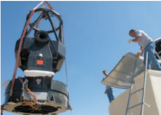
122 cm ayna çaplı teleskop gözlemevi kubbesinin içine yerleştirilirken.

duğu ve 7,5x7,5 açı dakikalık görüntü alanında 20 kadire kadar (yani gözün aletsiz görebildiği en sönük ışığın milyonda biri kadar) sönük gök cisimlerinin kaydedilebildiği saptandı. Devlet Planlama Teşkilatı (DPT) projesiyle Almanya'da Astelco firmasına yaptırılan 122 santimetre çaplı, Türkiye'nin öz kaynaklarıyla sahip olduğu en büyük optik teleskop ÇOMÜ Ulupınar Gözlemevi'de çalışmaya başladı. 27 Temmuz 2009 sabahı bir TIR ile Çanakkale Gümrüğü'ne ulaşan teleskop aynı gün gümrükten çıkarılıp Gözlemevi'ne indirildi.