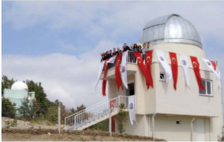
Gözlemevindeki 122 cm ayna çaplı yeni teleskobun resmi açılışı 06 Ekim 2009 günü üniversitede akademik yılın açılış töreninden hemen sonra yapıldı.

13 Ağustos 2009 Perşembe gecesi, saat 22:00. T122 adını verdiğimiz 122 cm çaplı yeni teleskobu ilk ışık gözlemleri için uzak gökadalara yöneliyoruz. Sessiz ve hızlı; siz üçe kadar saymadan hedef gökada merkezde bile. İlk ışık gözlemlerinde bir gama ışın patlaması bölgesi, 32 milyon ışık yılı uzaktaki gökada M74, 50 milyon ışık yılı uzaktaki gökada NGC 7331, aynı bölgedeki arka fon gökadar ve 105 milyon ışık yılı uzaktaki dev gökada NGC 7479 teleskoba takılan CCD detektör ile görüntüledi. Gözlemevi elemanlarının Alman Astelco Firması'nın 6 teknik elemanı ile birlikte sürdürdüğü on günlük kurulum ve ayar çalışmaları sonunda yeni T122 teleskobuyla ilk ışık gözlemleri yapıldı. Çanakkale Onsekiz Mart Üniversitesi (ÇOMÜ) Astrofizik Araştırma Merkezi (ÇAAM; http://physics.comu.edu.tr/caam/ ) Müdürü, yönetim kurulu üyeleri, birçok üye ve öğrenci tarafından gerçekleştirilen ilk ışık gözlemlerinde 15 dakikaya kadar uzun poz sürelerinde bile teleskop takibinin oldukça iyi ol-