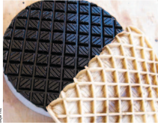
Fotograf 1: RTV silikon kalıp kullanılarak yapılan bir cilalama lapı

Cilalama ilerledikçe ısınmaya başlayan optik reçine, yüzeye sanki vakumlanmış gibi daha da yapışmaya başlar. Bunun nedeni, akarak şeklini iç bükey yüzeye daha da iyi uydurmasıdır. Lap ile ayna uyumunun arttığını, lapın giderek ayna üzerinde daha güç hareket etmeye başlamasından anlarız. Özellikle büyük aynalarda, lapı ya da aynayı hareket ettirmek, büyük güç gerektiren bir iş olmaya başlar.