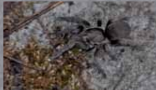
Chaetopelma concolor (Ortadoğu tarantulası)