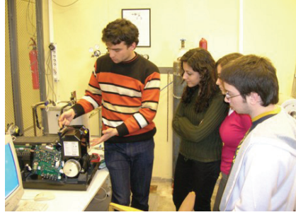
Mekanik ekibindeki arkadaşlarımız genç arkadaşlarımıza yakıt pili hakkında bilgi verirken

Mühendisliğin farklı renklerini bir araya getirerek ortak amaçlarda buluş-