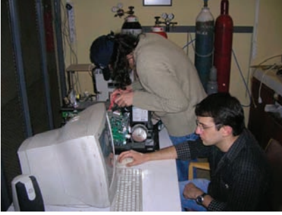
Mekanik ekibimizden arkadaşlar yakıt piliyle çalışırken.

yardıma açtık. Yarışa birkaç ay kadar bir süre kala üretim aktivitelerimizi tamamlamayı ve aracımızı test edebilmeyi hedefliyoruz.