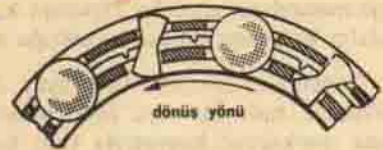
Şekil No. 2. — Kilit ile donatılmış avaza düzeni