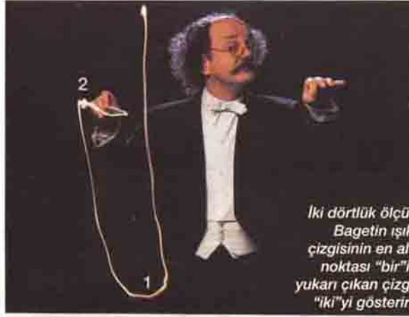
İki dörtlük ölçü: Bagetin ışık çizgisinin en alt noktası "bir", yukarı çıkan çizgi "iki"yi gösterir.

Ayakla yerı tekmelemek veya uzun sopayla yere vurmaktan korkunç gürültü yaptığı için, şefin kullanacağı sopa giderek küçüldü. Saray orkestraları barok çağının statü sembolü haline gelip müzisyen sayısı 50-60'a yükselince, orkestradan bir müzisyenin şefliği de üstlenmesi artık imkansız hale geldi. Bu işi ancak sadece yönetime konsantre olmuş, akustik ve optik bir anlayışa sahip bir kişi başarabiliyordu. Besteciler böylece kendi parçalarını yönetmeye başladılar. 4. Senfoni'sinin ilk provasında şefliği de üstlenen