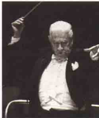
Sergiu Celibidache: Müziği uzattığı için ona "Yavaşlığın Üstadı" lakabı takılmıştı.