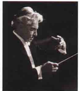
Herbert von Karajan: "Maestro" dünyayı yaratır gibi yönetiyordu.