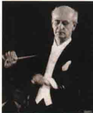
Wilhelm Furtwängler: İşaretleri belirsiz hareketlerden oluşuyordu.