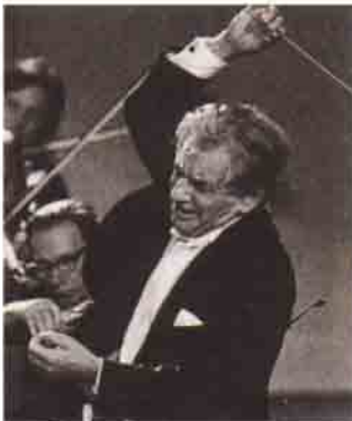
Leonard Bernstein: Canlılığı müzisyenleri de heyecanlandırıyordu.

Birçok şef çifte kabiliyete sahiptir. Bazıları işe Daniel Barenboim gibi piyanist, bazıları Lorin Maazel gibi kemançı, Carlo Maria Giulini gibi viyolaçı, Arturo Toscanini gibi çelist, Sir Co-