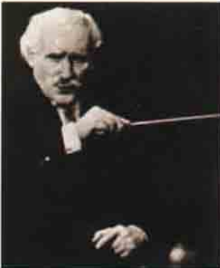
Arturo Toscanini: Eleştirilenler ve hayranları onu en önemli şef olarak kutluyorlardı.

Bu nota karmaşası içinde elbette bazı hileler yapılabilir. Roger Boggasch "Partitür nefesliler, yaylılar vs. biçiminde bloklara ayrılabilir" diye açıklıyor. Ayrıca "kırmızı çizgiler" var. Bun-