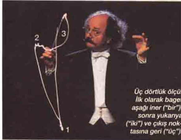
Üç dörtlük ölçü: İlk olarak baget aşağı iner ("bir"), sonra yukarıya ("iki") ve çıkış noktasına geri ("üç").