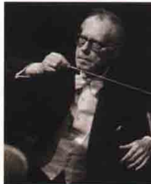
Karl Böhm: Mozart yorumcusu ve müziğin ağır işçisiydi.