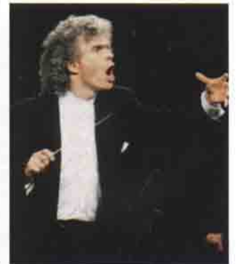
Simon Rattle: İngiliz şef "2000 yılının Karajan'ı" olarak anılıyor.