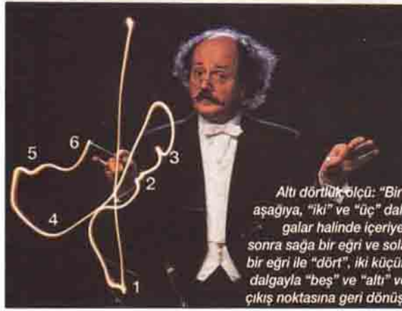
Altı dörtlük ölçü: "Bir" aşağıya, "iki" ve "üç" dalgalar halinde içeriye, sonra sağa bir eğri ve sola bir eğri ile "dört", iki küçük dalgayla "beş" ve "altı" ve çıkış noktasına geri dönüş.