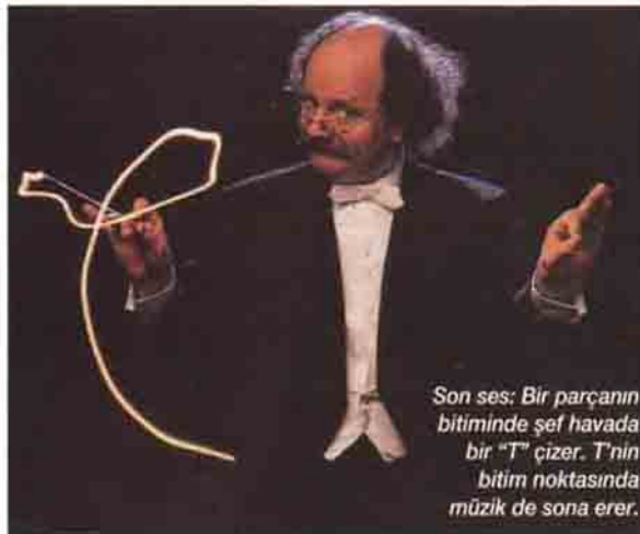
Son ses: Bir parçanın bitiminde şef havada bir "T" çizer. T'nin bitim noktasında müzik de sona erer.

Brahms, anlaşılmasayan el kol hareketleriyle bu henüz tanınmayan senfoniye daha da anlaşılabilir hale getirmişti. Brahms, Bülow'dan genel prova ve asıl konseri yönetmesini rica etti ve böylece müzisyenler doğru tınıyı buldular.