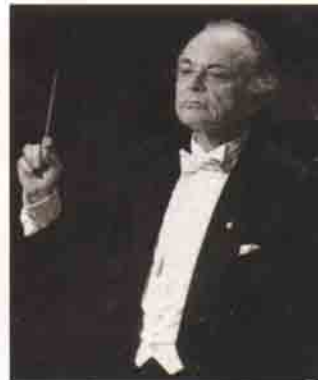
Lorin Maazel: Birçok müzisyen onun disiplinini ve özenini takdirle karşılamaktadır.