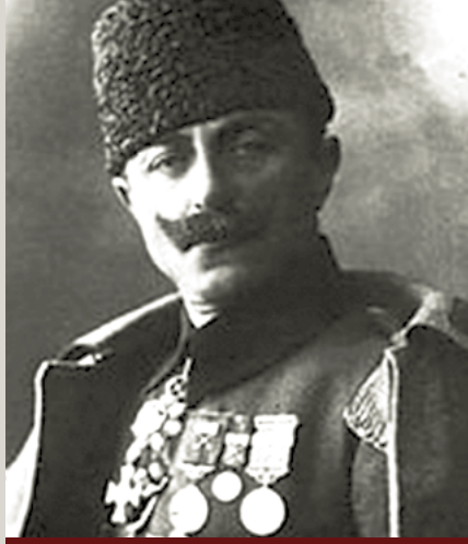
Cevat (Çobanlı) Paşa

Savaş sırasında Çanakkale'deki Türk komutanlarının en üst rütbelisi olan Esat Paşa, başta Mustafa Kemal olmak üzere cephede görev yapan birçok subayın Harp Okulu'ndan hocasıdır. Esat Paşa önce 3. Kolordu Komutanı olarak 1914 yılı başında Tekirdağ'da göreve başlar. Çanakkale Cephesi'nde Kuzey Grubu komutanlığı görevini üstlenir. Esat Paşa kara savaşlarında büyük bir başarı sağlayarak Anafartalar'ın ve Conkbayırı'nın da yer aldığı Kuzey Grubu bölgesini düşman kuvvetlerine karşı savunur. Emrindeki subayları çok iyi organize ederek ve ordu komutanı Sanders'le iyi ilişkiler kurarak zaferin kazanılmasında büyük bir paya sahip olur. Mustafa Kemal'i Anafartalar Grubu Komutanlığı görevine teklif eden kişi de kendisidir.