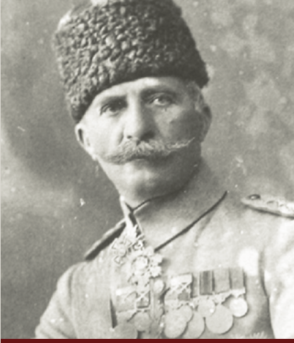
Esat (Bülkat) Paşa

Savaş sırasında Çanakkale'deki Türk komutanlarının en üst rütbelisi olan Esat Paşa, başta Mustafa Kemal olmak üzere cephede görev yapan birçok subayın Harp Okulu'ndan hocasıdır. Esat Paşa önce 3. Kolordu Komutanı olarak 1914 yılı başında Tekirdağ'da göreve başlar. Çanakkale Cephesi'nde Kuzey Grubu komutanlığı görevini üstlenir. Esat Paşa kara savaşlarında büyük bir başarı sağlayarak Anafartalar'ın ve Conkbayırı'nın da yer aldığı Kuzey Grubu bölgesini düşman kuvvetlerine karşı savunur. Emrindeki subayları çok iyi organize ederek ve ordu komutanı Sanders'le iyi ilişkiler kurarak zaferin kazanılmasında büyük bir paya sahip olur. Mustafa Kemal'i Anafartalar Grubu Komutanlığı görevine teklif eden kişi de kendisidir.