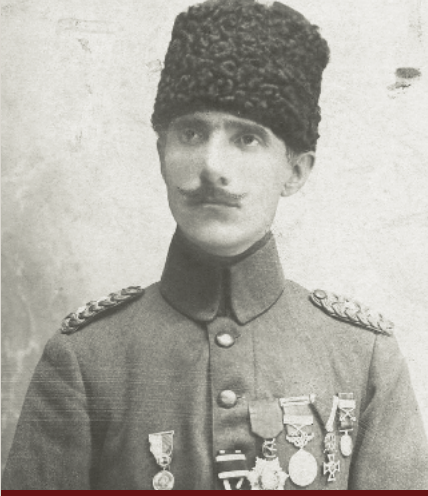
Yarbay Şefik (Aker) Bey

Çanakkale Savaşları'nın seyrine doğrudan etki eden komutanlardan biri de 27. Alay'ın komutanı Mehmet Şefik Bey'dir. Ekim 1914'te 27. Alay komutanlığına tayin edilen Mehmet Şefik o sırada yarbay rütbesinde bulunmaktaydı. Bu görevi 8 Ağustos 1915'e kadar devam eder. 27. Alay Gelibolu'da 9. Tümen'e bağlı olarak görev yapar. Alaya verilen görev Azmakdere'den Arıburnu ve Çamtepe sırtlarına kadar olan kıyının gözetlenmesidir. Alay çeşitli çıkarma ihtimallerini dikkate alarak kıyılarda birçok tatbikat yaparak savaşa hazırlanır. Bir gün önce tatbikat yapıldığından, 25 Nisan sabahı başlayan çıkarmayı Şefik Bey'in birlikleri karşılayacaktır.