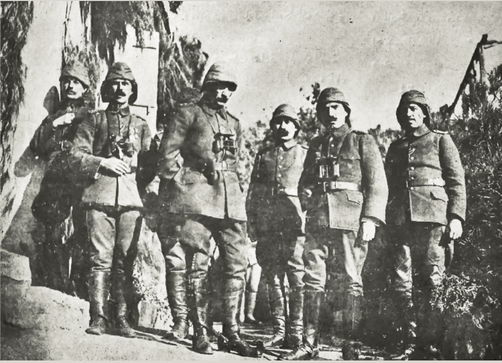
Anafartalar Kumandanı Mareşal Mustafa Kemal Bey ve maiyeti