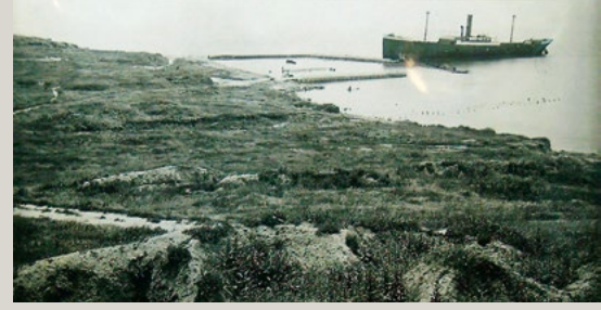
Ertuğrul Koyu ve River Clyde gemisi

"Erler, isabetli atışlarıyla düşmanı denize yuvarlıyordu. Ertuğrul Koyu sahili bir an içinde balık istifi gibi düşman cesetleriyle dolmuştu. Askerin bir fişegi bile boşa gitmiyordu. Birkaç defa bir fişekle birkaç düşmanın vurulduğu vaki oluyordu."