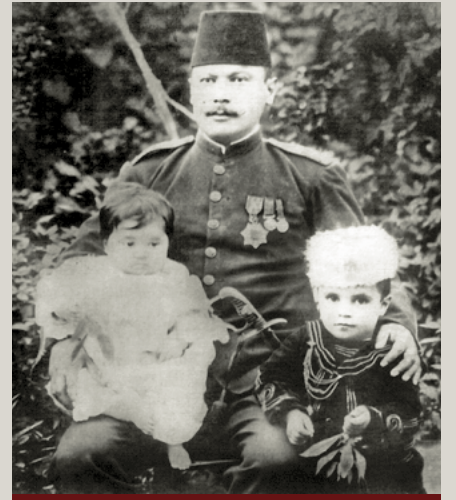
Hüseyin Avni Bey

Mustafa Kemal'in Çanakkale Zaferi'nde etkin olduğu diğer bir tarih ise Ağustos 1915'tir. 9- 10 Ağustos Muharebeleri İngilizler için sonun başlangıcı olduğu gibi dünya tarihine de Mustafa Kemal'i armağan eder. Mustafa Kemal'in 289 gün süren Çanakkale cephesindeki görevi 10 Aralık 1915'te son bulur.