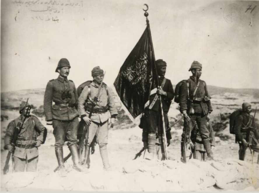
Kanlısırt'ta dikilen bir gazi alayı sancağı

Bugün Kemalçileri olarak bilinen 165 rakımlı tepeye varıp taarruz vaziyeti aldığında saat 7.40'tır. Yarbay Şefik Bey taarruz öncesi saat 07.55'te 19. Tümen'in Kocaçimentepesi'ni tutmasını ister.