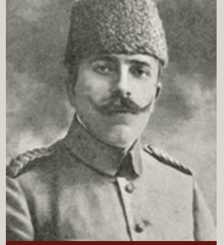
Cephede Bir Kardeş: Vehip (Kaçı)

Esat Paşa “ Düşman donanmasına Çanakkale Boğazı'na yaklaşmak ve Boğaz'ı zorlayıp İstanbul'a gelmek fırsatını vermeyenlerin birincisi Cevat Paşa, ikincisi ben, kesin sonucu sağlayan da Anafartalar komutanı Mustafa Kemal Paşa'dır ” demiştir. Cevat Paşa, Çanakkale'de Müstahkem Mevki komutanı olarak göreve başlar ve Boğaz'da aldığı tedbirlerle deniz muharebelerinin kazanılmasında önemli bir rol oynar. Boğaz'ı savunmak için top ve bataryaların hazırlanmasını ve mayınların ustaca yerleştirilmesini sağlar. Cevat Paşa Boğaz'ı savunmak amacıyla bir plan yaparak dört savunma bölgesi oluşturur, her bölgeye ayrı görevler verir, düşman donanmasının manevra yapacağı ve demirleyeceği Erenköy Koyu'na 7-8 Mart'ta Nusret'e mayınları o döşetir. Bu koya batarya takviyesi yaptırır. 18 Mart günü gerçekleşen deniz saldırısı sırasında Maydos'ta Esat Paşa'nın yanında olan Cevat Paşa harekâtın önemini fark ederek görev yerine gelir ve komutayı devralır ve müttefik donanması geri çekilirken “ Gittiler... Geçemediler... Geçemeyecekler... ” sözünü söyler. Cevat Paşa, Vehip Paşa'nın cepheden ayrılmasından sonra Güney Grubu komutanlığı görevini üstlenecektir.