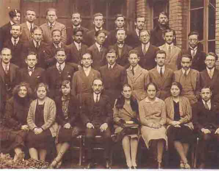
Sorbonne, Genel Fizik 1929