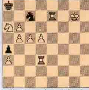
Problem III Brian Harley "South African Chess magazine", 1937 I. ödülü 3 hamlede mat