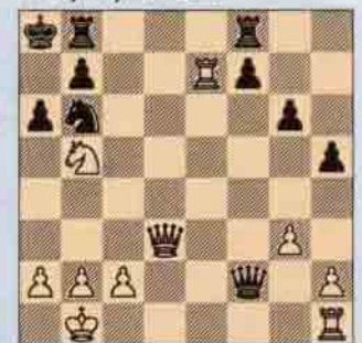
VIII. Beyaz oynar kazanır.