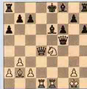
III. Beyaz oynar kazanır.