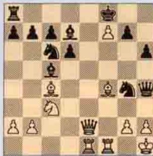
II. Beyaz oynar kazanır.