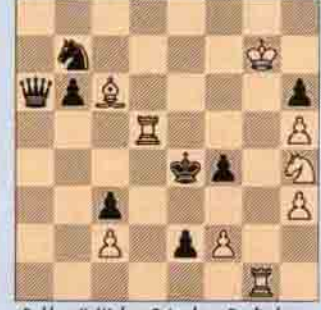
Problem II Walter Grimshaw Engliches Turnier, 1852 I. ödülü 3 hamlede mat