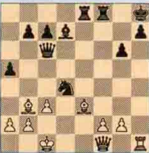
I. Beyaz oynar kazanır.