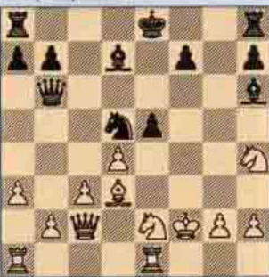
V. Siyah oynar kazanır.