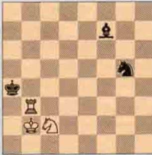
Etüd II A. Koprin New Statesman, 1959 I. Ödülü II. Beyaz oynar kazanır.