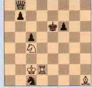
Problem IV Miroslav Havel "Natal Mercury", 1911 3 hamlede mat

üçüncü oldular. Benim de aralarında bulunduğum Ulusal takımımız 42. sırada idi.