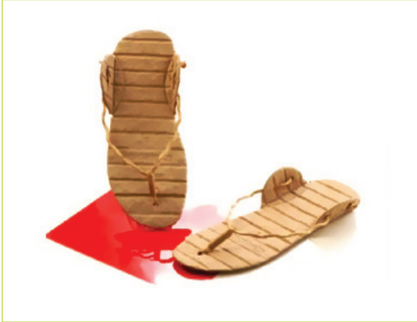
Geri dönüşümlü kağıt sandallar

Kağıt kullanımında sınırsızlığı zorlayan örnekler üzerinden devam ederken, bir Hint tasarımı karşımıza çıkıyor. Özellikle atık kağıtların yeniden kullanımını değerlendiren bu zanaat ağırlıklı çalışma, ev kadınlarına gelir sağlayacak bir olanak sunup kağıtların yeniden kullanımı konusunda çevreci bir yaklaşım sergiliyor.