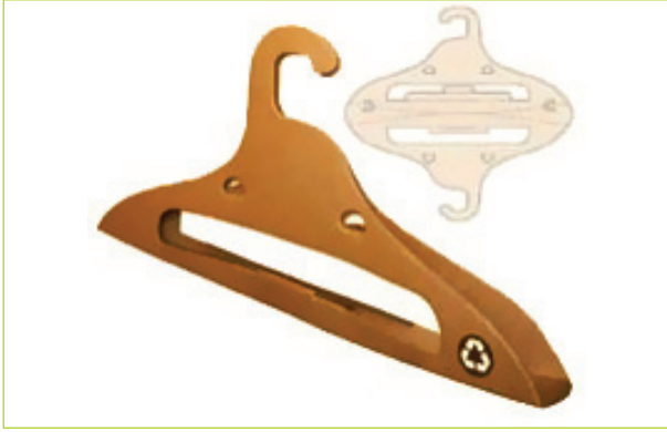
Rus tasarımcılar Alexey Chugunnikov ve Alexander Sekirash tarafından geliştirilmiş kağıt askı

Kağıt kullanımında sınırsızlığı zorlayan örnekler üzerinden devam ederken, bir Hint tasarımı karşımıza çıkıyor. Özellikle atık kağıtların yeniden kullanımını değerlendiren bu zanaat ağırlıklı çalışma, ev kadınlarına gelir sağlayacak bir olanak sunup kağıtların yeniden kullanımı konusunda çevreci bir yaklaşım sergiliyor.