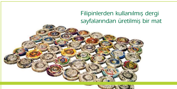
Filipinlerden kullanılmış dergi sayfalarından üretilmiş bir mat

Filipinler'den bir başka örnekteyse, altın madeninde çalışan kadınlarca yeniden üretime kazandırmak amacıyla kullanılmış eski dergilerden yapılan dekoratif matlar yer alıyor. Rulo yapılarak yüzey kazandırılan kullanılmış dergi sayfalarının bir araya getirilerek dikilmesiyle, son derece dekoratif ve kolay üretilen ürünler, ilginç bir örnek olarak hayranlık uyandırıyor.