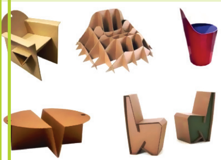
Ambalaj kâğıtlarından alternatif ürün çözümlenmeleri