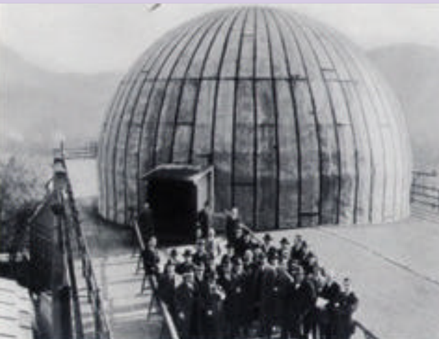
Zeiss 1, ilk evi olan, Jena'daki fabrikanın çatısındaki derme çatma kubbenin altında 50 000 konuk ağırıyor. [1923-1925]