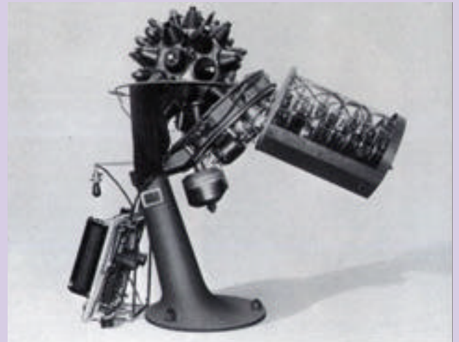
Ağustos'ta ilk kez denenen projektör, Deutsches Museum'a ses-sizce ilk ziyaretini yapıp, rötuşlar için Jena'ya dönüyor. [1923]