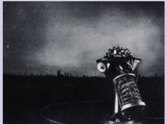
Deutsches Museum projektörü nihayet teslim almış. Münih'teki parlak günler II. Dünya Savaşı patlayıncaya kadar sürecek... [1925]