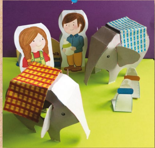
Fatma Nur Yeğenoğlu Tasarım ve çizim: Pinar Büyükgüral

kat yerinden öne, diğer iki kat yerinden arkaya katlayacaksınız. Üzerinde damla resmi bulunan alanlara yapıştırıcı sürün. Bu alanları, kendilerine denk gelen beyaz dikdörtgenlere yapıştırın. - "Meraklı Minik Yavru Fil Bakımevi" yazan parçayı da ortadaki kat yerinden dışa katlayın. Diğer iki kat yerinden öne katlayın. Bu parçanın üzerinde damla resmi bulunan alanlarına yapıştırıcı sürün. Daha sonra bu alanları birbirine yapıştırın. - İşte Yavru Filler ve Bakıcıları Maketi'niz hazır! Maketin, tabela dışındaki tüm parçalarını parmağınızla takarak bu parçaları kukla gibi hareket ettirebilir, oyunlar oynayabilirsiniz.