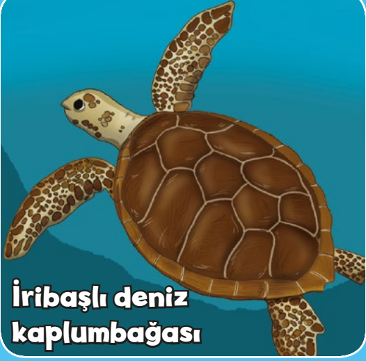
İribaşlı deniz kaplumbağası