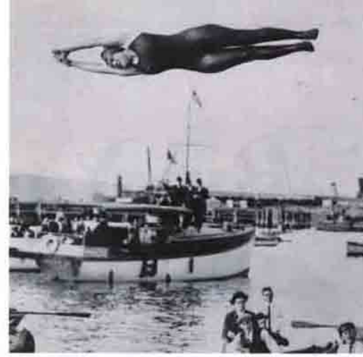
Tramplenden atlama'nın 19. yy'da yaygınlaşmaya başladığı günlere ait bir fotoğraf.

olimpiyatların, sporun gelişimi için çok fazla şey ifade etmediği söylenebilir. Dünya kupası, Avrupa, Asya şampiyonları gibi organizasyonları, sporun kendisi için daha hayırlı işler yapıyor gibi görünüyorlar. Şu anki en önemli olimpiik mücadele, gelecekteki olimpiyat organizasyonlarının ev sahipliğini kapmaya çalışan kentlerin kavgası olmuştur. İlkel sporlar vurguya el, ayak veya sopalar yardımıyla oynanıyor olsun, top oyunlarına yüklemişlerdi. Klasik çağda ise, bu tipte oyunlar asla yüceltilmemiştir. Eski Yunan olimpiyatlarında top oyunlarına yer verilmemiş, bu oyunlar "çocuk oyunu" olarak nitelendirilmiştir. Eski Romalılar da, top oyunları için hamamlarının kenarında gösterişsiz alanlar ayırıp, görkemli arenaları at arabası yarışları ve gladyatör düelloları için inşa etmişlerdir. Orta çağda, İngiltere'de krallar top sporlarını bütünüyle yasak-