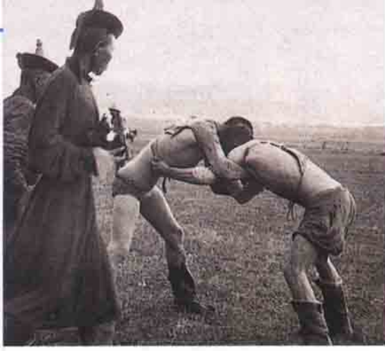
Moğol güreşçileri, 1920'lerde, dünyanın en eski sporlarından birini gerçekleştiriyorlar. Sudan'da, kökü eskilere dayanan aynı geleneği izleyen Nubya yerlileri güreşiyorlar.