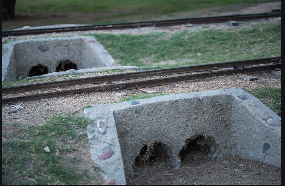
Yolculuk yapan trenlerin içine yerleştirilen kuantum gravimetrelerle menfezlerin tıkalı olup olmadığı anlaşılabilir.

Yapılması planlanan bir inşaatın güvenli olup olmadığının değerlendirilmesinin yolu toprak yapısının ve yer altı sularının