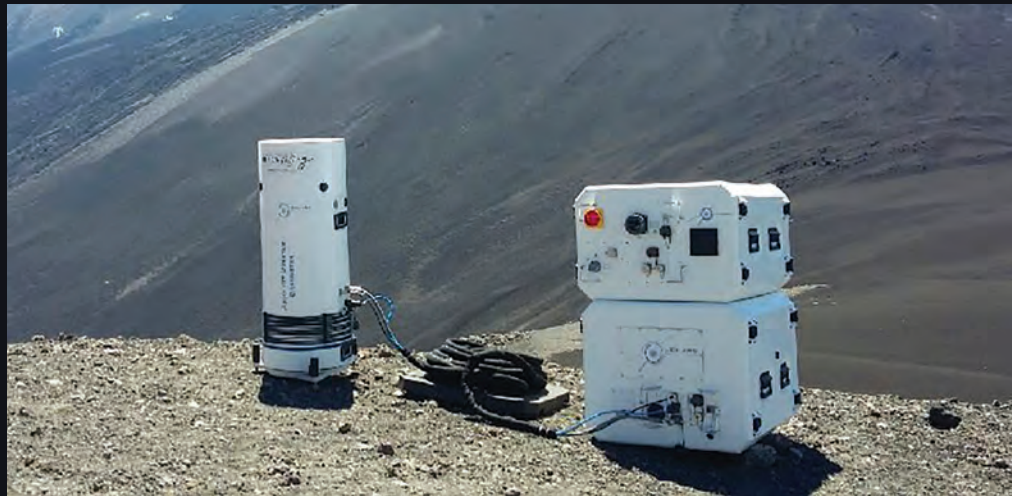
\mu QUANS şirketi tarafından geliştirilen "Absolute Quantum Gravimeter" adlı cihaz

Fransız \mu QUANS şirketi kendi geliştirdiği ve "Absolute Quantum Gravimeter" adını verdiği bir sensörü Etna yanardağının zirvesinin yakınlarına yerleştirdi. Cihaz yaklaşık bir yıldır çalışmaya ve veri toplamaya devam ediyor. Araştırmacılar farklı zamanlarda alınan ölçümler arasındaki kütle farklarını takip ederek volkanın derinlerindeki magma miktarında yaşanan değişimleri ölçüyor. Elde edilen sonuçların volkanlarda