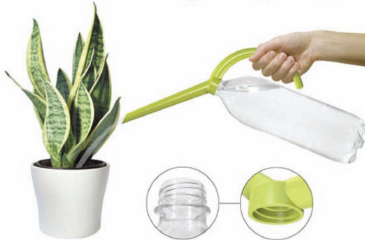
Geridönüşümlü malzemeyle basit bir çiçek sulama ürünü oluşturulması, 2005 MACEF Tasarım ödülü