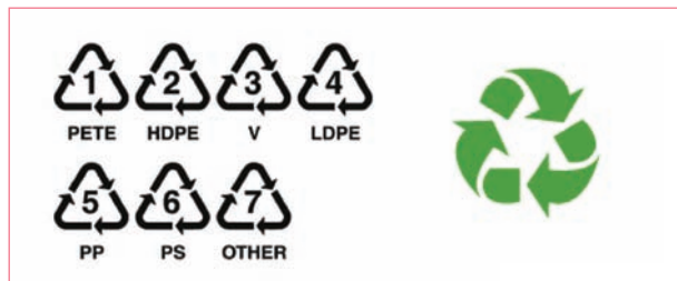
Uluslararası plastik geridönüşüm kodları

Sadece evsel atıkların bile, düzenli toplanmaları ya da bir şekilde çöplerin ayrıştırılmasıyla, hızla yeniden üretilme potansiyeline sahip olduğunu biliyor musunuz?! Pek çok plastik malzemenin üzerinde yer alan uluslararası işaret sisteminin anlamları (şekil 2-3) ve kullanım yöntemlerine ilişkin bilginiz var mı?