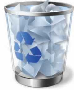
Uluslararası plastik geridönüşüm logosu ve uygulamaları

Geri dönüşümlü atık ürünlerin tekrar değerlendirilmesine yönelik yarışmalar ve yaratıcı gücün ortaya çıkarılmasının teşvik edilmesiyle ilginç ürünler ortaya çıktı gözleniyor. Aşağıdaki şekilde gördüğümüz ve farklı pet şişelere de uygulanabilen tasarım, etkileyici bir çözümleme örneği ile ödül almıştı.