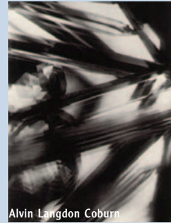
Alvin Langdon Coburn

o sanatın tekniğinin öne çıkacağını habercisidir. 20. yüzyılın ilk 20 yılında, Fovizm, Dışavurumculuk, Kübizm ve Gelecekçilik hareketlerinin de içinde bulunduğu temel sanat akımlarının tümü, bir biçimde, soyut yaklaşımla gerçeklik arasındaki ayrılığı vurgular. Oluşan bu ortamın getirdiği yeni özgürlük ve sorumluluklara yalnızca ressamlar değil, fotoğrafçılar da sahip çıkarlar. I. Dünya Savaşı’ndan hemen önce, Wassily Kandinsky’nin de içinde olduğu bazı sanatçılar tam anlamıyla soyut sanata yönelirler. Kandinsky, 1910 - 11’de yaptığı resimlerle, salt soyut resmin yaratıcısı kabul edilir. Başta Paul Klee olmak üzere bu görüşten etkilenen çok sayıda ressamın yanı sıra, fotoğrafçılar da, “görsel deneyler” yaparak soyut fotoğraflar elde etmenin yollarını aramaya başlarlar. Gelecekçi akımın içerisinde şekillenmiş olan Vortisizm’in temsilcilerinden fotoğrafçı Alvin Langdon Coburn’un “Vortograf”ları, soyut anlamda ilk fotoğraflardır. Soyut çalışmalarına damgasını vurmuş; dadaist ve yapısal sanatçılar Laszlo Moholy-Nagy ve Man Ray, soyut görüntüler elde etmek için fotogram, sertleştirme, S/B ve renkli tonlara ayırma, solarizasyon, optik bozulma gibi yöntemleri kullanırlar.