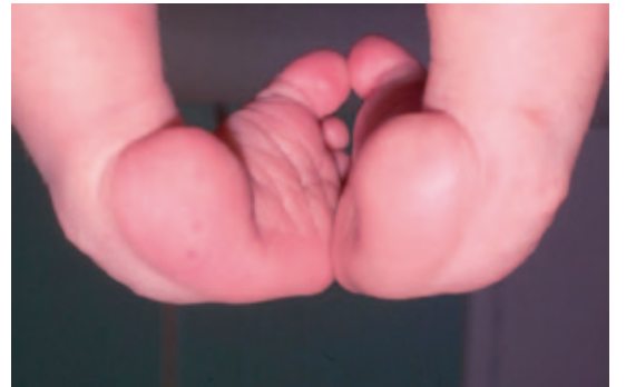
Yaklaşık her bin doğumdan birinde görülen çarpık ayaklılık