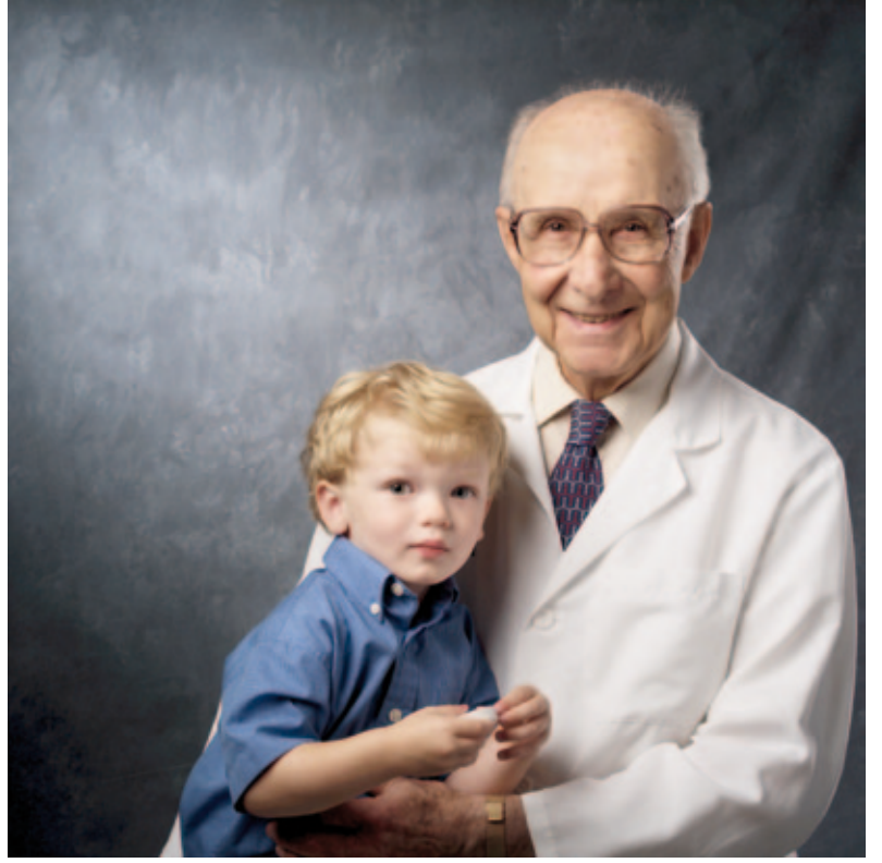
Dr. Ignacio Ponseti ve çarpık ayaklarını düzeltilmiş olduğu bir hastası