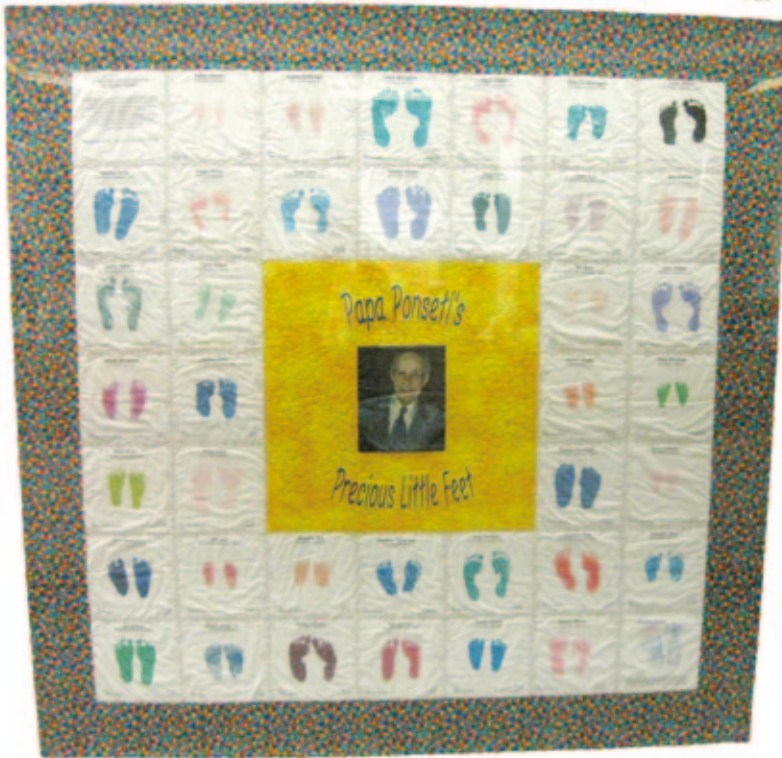
Hasta yakınlarının Dr. Ignacio Ponseti için yaptığı ve Iowa Üniversitesi Hastanesi, Ortopedi Kliniği'nin girişinde bulunan battaniye. Battaniyenin ortasında Dr. Ponseti'nin fotoğrafı ve onun etrafında tedavi ettiği çarpık ayaklı çocukların tedaviden sonraki ayak izlerinin fotoğrafları yer alıyor.

Özellikle geri kalmış ve gelişmekte olan ülkelerde gerçekleşen doğumlarda ortalama her 1000 bebekten biri çarpık ayakla doğuyor.