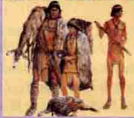
Anasazi erkekleri ok ve yayla ava çıkarıyor; fasulye ekiyor. Kadınlar ise seramik ve firüzedan süs eşyaları üretiyor. Hind evleştirilmişti.

Bu kentin insanları nasıl yaşıyordu? Yapılan birçok araştırmaya karşın, soru hâlâ büyük ölçüde yanıtız. Kalıntıların içinde bulunan yığınlarca seramik parçası da bir başka ilginç nokta. Bu parçalara bakarak arkeologların yaptığı hesaplara göre, 1000 kişilik nüfusun 150 yıllık tarihi boyunca 150000 tane testi kırması gerekiyor. Buradan çıkan sonuç, Pueblo Bonito'nun bölgenin dini ve ekonomik merkezi olduğu. Bölgenin dört bir yanından gelen işadamları ve seyyahlar, bu kente sürekli girip çıkıyor olmalıydı.