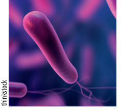
thinkstock Helicobacter pylori

! Harvard Üniversitesi tarafından 1991 yılından itibaren Nobel'in bir parodisi olarak en anlamsız ve yeniden üretilmeyecek, üretilmemesi gereken bilimsel çalışmalara Ig (Ignoble) Nobel Ödülü veriliyor.