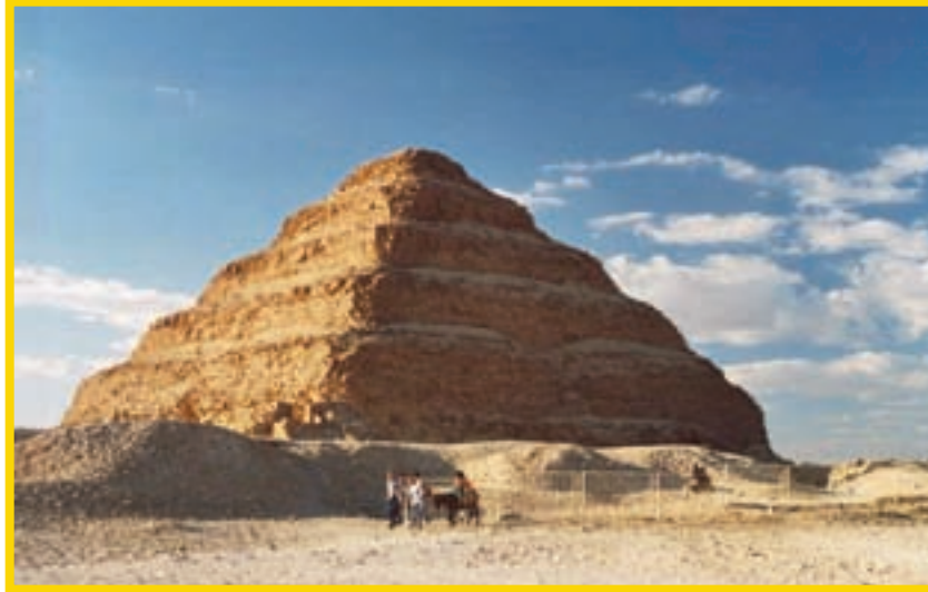
Fotografda, Sakkara'daki ünlü Basamaklı Piramit görülüyor.

Mısır'ın Sakkara kentinde, Kral Zoser için yapılmış ünlü Basamaklı Piramit, bilinen ilk piramit olma özelliğine sahip. 2006 yılında, bir grup mezar soyguncusu, bu piramidin hemen yakınındaki alanı hedef olarak seçmiş. Ancak, daha kazıya başlar başlamaz Mısır polisi tarafından fark edilerek tutuklanmışlar. Kısa bir süre sonra, mezar soyguncularının ortaya çıkardığı kalıntıları incelemek üzere bölgeye arkeologlar gelmiş. İşte, büyük haber o zaman tüm dünyaya yayılmış. Burada bulunan 4200 yıllık mezarların, kraliyet ailesinin üç dişçisine ait olduğu anlaşılmış. Mezarlardan birinin girişinde, mezara izinsiz girmek isteyenler için