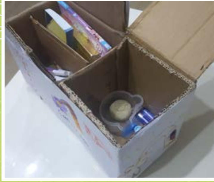
Ceylin Gümüşsoy Bahçeşehir Koleji / Z-B / Manisa