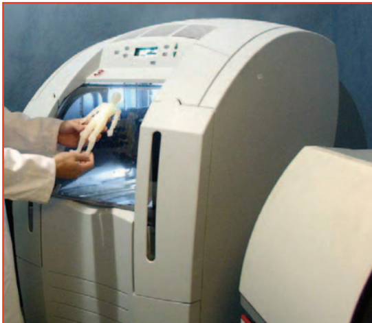
Üçboyutlu yazıcılar genellikle resimdekine benzeyen büyük aletler.

Üçboyutlu baskı yapabilen yazıcılar, bir süredir özellikle endüstriyel tasarım yapanlar tarafından yaygın olarak kullanılıyorlar. Üçboyutlu yazıcı, içine koyulan özel malzemeyi bilgisayar tasarımına uygun olarak kesip biçen bir yazıcı çeşidi. Örneğin, bilgisayarda bir bisiklet parçası tasarladıysanız, bu yazıcılarda elle tutulabilir bir modelini hazırlayabiliyorsunuz (bunun nasıl bir şey olduğunu görmek isterseniz http://www.zcorp.com/products/demo.asp?ID=1 adresini ziyaret edebilirsiniz). Elbette bu teknoloji henüz evlere girebilmiş değil, nedeni yazıcı fiyatlarının çok yüksek olması. Bu sorunu aşmak için uğraşan İngiltere'deki Bath Üniversitesi araştırmacıları, "Bu tür aygıtlarla üçboyutlu nesnelere oluşturabiliyorsak, neden yazıcıyı oluşturan parçaları da kendisine yaptırmayalım?" diye düşünmüşler. Bu düşüncenin sonucunda ortaya RapRap adı verilen proje çıkmış ( http://staff.bath.ac.uk/ensab/replicator ). Bu düşünce gerçekleştirilebilirse, üçboyutlu bir yazıcı alıp içine uygun malzemeleri koyarak yeni bir yazıcı oluşturmak için gerekli tüm parçaların hazırlanması sağlanabilecek. Aynı şekilde eskiyen yazıcının güncellenmesi için gereken parçaları yine yazıcıya ürettirip daha gelişmiş bir yazıcıya sahip olmak da mümkün olacak.